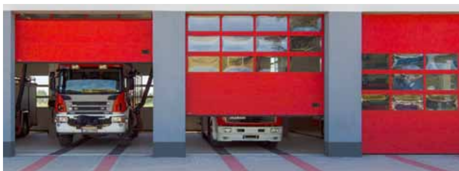
BRAMA SEGMENTOWA K2 IA aluminiowa z sekcjami przeszklonymi