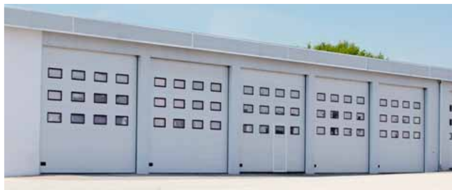
PANELE BRAM STALOWYCH Z OKIENKAMI Doświetlają wnętrze i poprawiają warunki pracy.