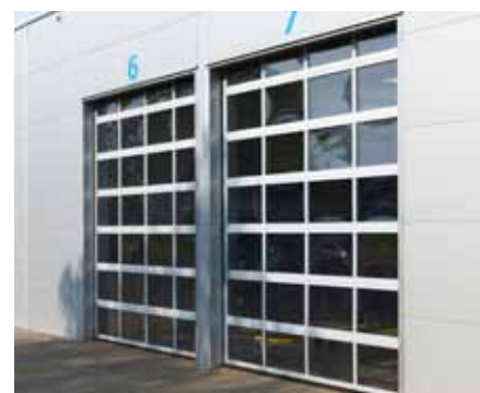
BRAMA SEGMENTOWA K2 IP z sekcjami przeszklonymi