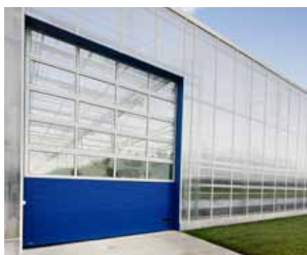
BRAMA SEGMENTOWA K2 IM stalowa, przeszklona, mikroprofilowana