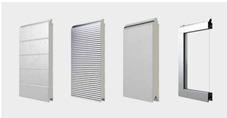
PANELE BRAM SEGMENTOWYCH (od lewej): panel K2 IS/K2 IA, panel K2 IM, panel K2 IS 60, panel K2 IP

Sekcje bram mają grubość 40 mm i wypełnione są pianką poliuretanową. Do obiektów wymagających wysokiej izolacji termicznej polecamy najcieplejszą bramę KRISPOL K2 IS 60. Zbudowana jest z gładkich paneli o grubości 60 mm i posiada rozbudowany system uszczelnień obwodowych – podwójne uszczelnienie dolnego panelu i dwuwargową uszczelkę boczną. Obok typów stalowych oferujemy także bramy aluminiowe K2 IA i K2 IP. Brama K2 IA o tłoczeniu wąskim wygląda identycznie jak jej stalowy odpowiednik K2 IS, ma jednak mniejszy ciężar i jeszcze wyższą odporność na korozję. Ciekawą alternatywą dla bram pełnych są całkowicie przeszklone bramy K2 IP, które wyróżniają się nowoczesnym designem, eksponują i doświetlają wnętrza obiektów.