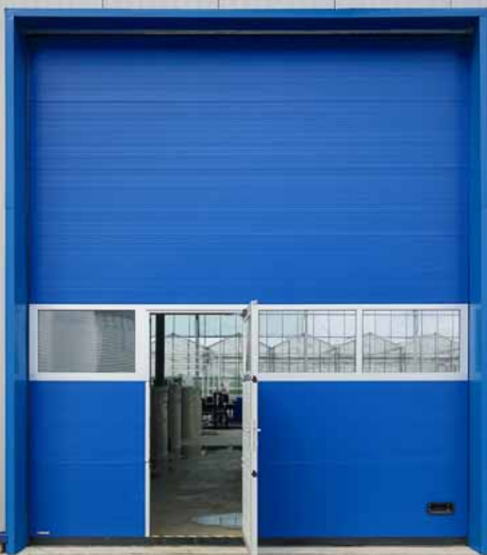
BRAMA SEGMENTOWA K2 IM

Dostarczamy naszym Klientom najlepsze, innowacyjne rozwiązania, które sprawdzą się w każdych warunkach. Nieważne, czy mówimy o małym warsztacie, czy o wielkopowierzchniowej hali magazynowej. W przypadku każdej inwestycji tak samo ważne jest, aby stworzyć bezpieczne i komfortowe warunki dla rozwoju biznesu. Nasze produkty z linii FIRM powstają właśnie w tym celu.