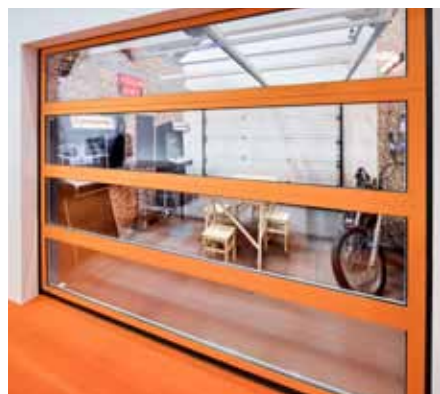
SEKCJA IP BEZ PIONOWYCH SŁUPKÓW Dzięki przeszklonym sekcjom brama pełni funkcję witryny.