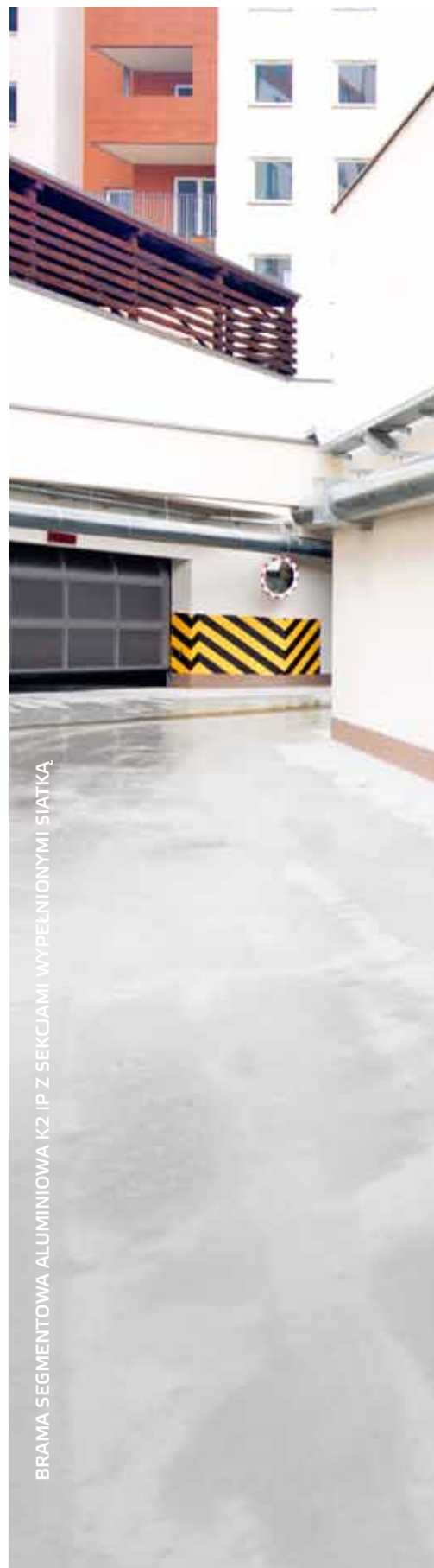
BRAMA SEGMENTOWA ALUMINIOWA K2 IP Z SEKCJAMI WYPELNIONYMI SIATKĄ