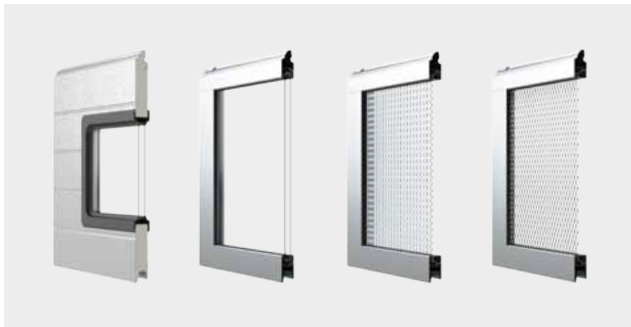
SEKCJE SPECJALNE (od lewej): IS/IA z oknami, IP z podwójną szybą, IP z blachą perforowaną, IP z siatką aluminiową

Interesującym rozwiązaniem są panele bram stalowych z oknami lub przeszklone sekcje aluminiowe. Wypełnione pojedynczą lub podwójną szybą z trwałego i odpornego na zarysowania tworzywa sztucznego są ciekawym elementem architektonicznym. Bramy przeszklone mogą pełnić funkcję okien wystawowych lub dyskretnie wydzielać przestrzeń w pomieszczeniu, jeśli wypełni się je matowym, dymionym lub mlecznym szkłem.